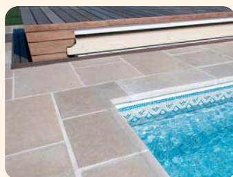
2 Le caillebotis s'élève automatiquement et présente la couverture