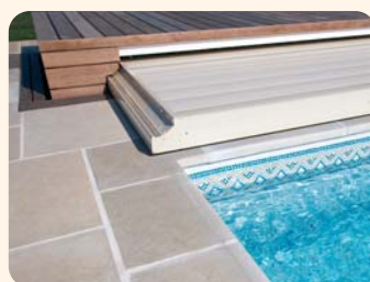
3 Les panneaux rigides se déploient et roulent sur le dallage