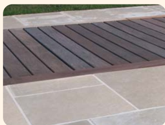
1 Piscine ouverte, la couverture est totalement invisible

AGORA inaugure un nouveau concept de couverture automatique de piscine rigide et entièrement escamotable. Une exclusivité technique brevetée qui conjugue les exigences de sécurité et d'esthétisme des piscines haut de gamme.