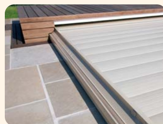
4 La couverture en place empêche tout contact avec la piscine